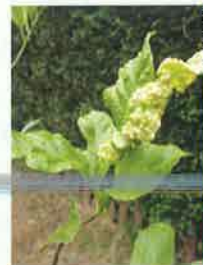
Agallas en hojas de Citrus spp.

Si las ninfas presentan una elevada densidad de población las hojas aparecen retorcidas, con aspecto rizado y clorosis.