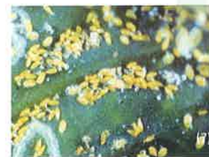
Huevos de T. erytreae

Desarrollo ninfal de 5 estadios con duración de 17-43 días, en función de la temperatura.