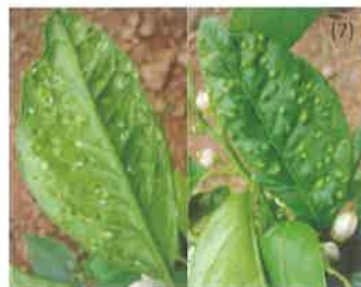
Hoja de Citrus spp.