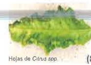
Hojas de Citrus spp.

Se producen agallas (que albergan las ninfas), deformaciones y amarilleamiento de los brotes jóvenes de las rutáceas, cuando la colonia de ninfas está multiplicándose.